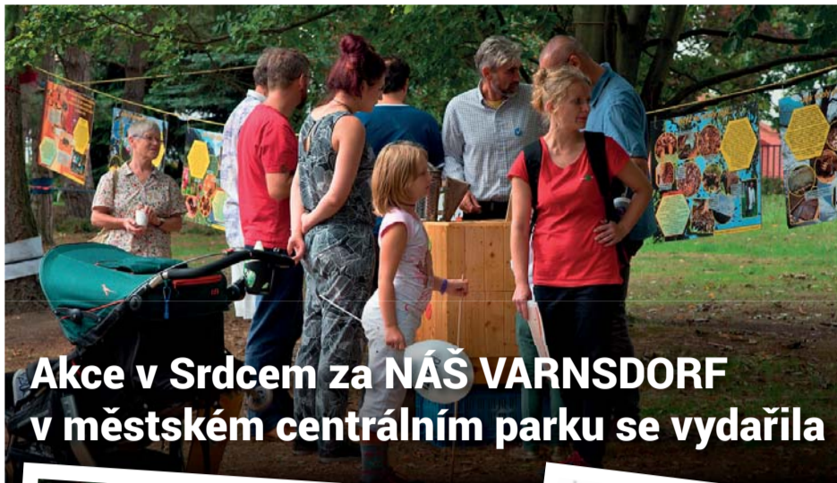
Akce v Srdcem za NÁŠ VARNSDORF v městském centrálním parku se vydařila