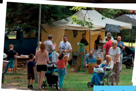
Fota z akce Srdcem za NÁŠ VARNSDORF